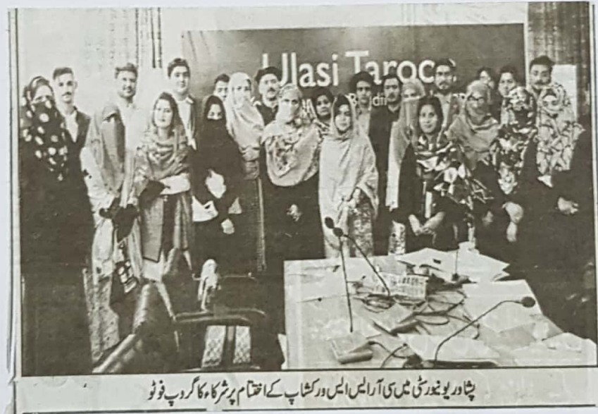
پشاور یونیورسٹی میں سی آر ایس ایس ورکشاپ کے اختتام پر شرکاء کا گروپ فوٹو