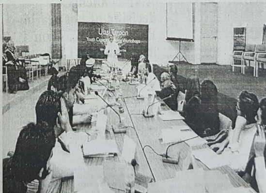
dire need to educate the tribal people about their rights as equal citizens to enable them effectively exercise the rights constitutionally available to

Headquarters, Kohat said that rule of law means that everyone is subject to and equally accountable before law, regardless of the socio-political and economic backgrounds. KP police through its massive reformation have different services on offer which are oriented for public welfare, safety and security and to meet the policing needs of the communities. The role of students from the newly merged districts in exceptionally important to uphold rule of law, he said adding that youth cannot only promote the prerequisites and virtues of rule of law but also act as inspiring examples by being law abiding citizens. He said there is a