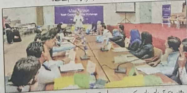
پشاور: سی آر ایس ایس کے زیر اہتمام اوسی ترون کے سیمینار میں طلباء و طالبات شریک ہیں

پشاور (یکسپریس رپورٹر) خطے میں جمہوریت کی ترقی کے لئے قبائلی نوجوانوں کا کلیدی کردار ہے اور یہ کردار فانا کا پختونخوا میں انضمام کے بعد مزید بڑھ چکا ہے جبکہ شہریوں کے شکایات کا ازالہ حتمی اور جامع جمہوریت کا بنیادی وصف ہونا چاہئے۔ ان خیالات کا اظہار یونیورسٹی آف پشاور کے پروفیسر ڈاکٹر جمیل چترالی نے سی آر ایس ایس کے زیر اہتمام اوسی ترون کے نام سے دو روزہ ورکشاپ سے خطاب کرتے ہوئے کیا۔ فانا یونیورسٹی میں منعقدہ ورکشاپ میں فانا یونیورسٹی کے علاوہ کوہاٹ یونیورسٹی اور پرنس یونیورسٹی کوہاٹ کے تیس طلباء و طالبات نے شرکت کی۔ یہ ورکشاپ سی آر ایس ایس کے اوسی ترون پروگرام کا حصہ ہے جس کا بنیادی مقصد نوجوانوں کے تنقیدی صلاحیتوں کو نکھارنا ہے تاکہ وہ دوسروں کے خیالات عقائد و نظریات کا احترام کے ساتھ جائزہ لے کر آگے بڑھے اور ایک پر امن معاشرے کے قیام میں اپنا کردار ادا کر سکے۔ انھوں نے کہا کہ خطے میں امن اور ترقی کے لئے فانا کا انضمام ناگزیر تھا۔ صوبہ خاں نے کہا کہ انضمام کے بعد قبائلی نوجوان قانون کی حکمرانی سمجھنے بنانے کے لئے آگے بڑھے۔ انھوں نے کہا کہ اب وقت آ گیا ہے کہ قبائلی نوجوان یہ ثابت کرے کہ وہ مہذب قانون کے پاسدار اور جمہوری اصولوں کے پیروکار ہیں۔ سی آر ایس ایس کے پروگرام منیجر مصطفیٰ ملک اور ماہر تعلیم اور اسٹریٹیز سٹڈیٹ گل نے بچوں پر زور دیا کہ وہ خود کو جدید دور کے تقاضوں کے مطابق تعلیم کی طاقت سے لیس کرے اور تنگ نظری، امتیاز اور تشدد کی بجائے محبت رواداری اور قانون کی حکمرانی سے جینے کا طریقہ سیکھے۔ پروگرام کے آخر میں ورکشاپ میں حصہ لینے والے طلباء و طالبات میں سریفیٹ تعلیم کئے گئے۔