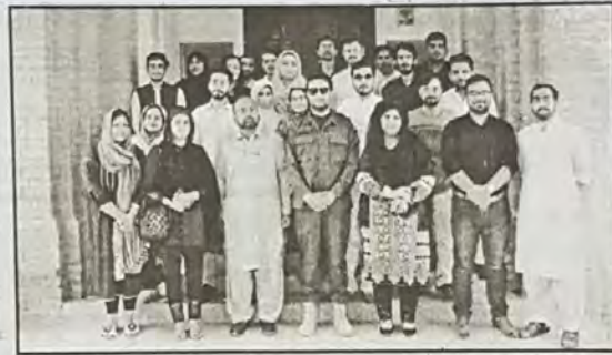
سی آر ایس ایس کے زیر اہتمام اسی تہ دنوں کے نام سے دو روزہ ورکشاپ کے اختتام پر شرکاء کا گروپ فوٹو