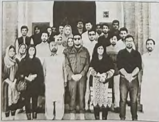
پشاور سی آرائیں ایس کے ذریعہ اہتمام ورکشاپ کے دوران شرکاء کا گروپ فوٹو