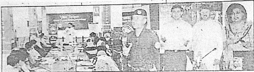
سات ایس بی آپریشن نور جمال مصطفیٰ ملک، قلمش سوسائٹی اور دیگر قانون کی بلا دستی کی شہینہ پریمینار سے خطاب کر رہے ہیں۔