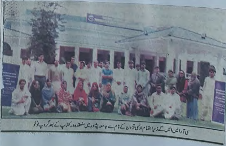
سی آر ایس ایس کے زیر اہتمام اولی تہوں کے نام سے جامعہ پشاور میں منعقدہ ورکشاپ کے بعد گروپ فوٹو

پشاور (خبرنگار) جمہوریت کی بنیاد اور ترقی کیلئے دوسروں کی رائے کا احترام اور فیصلہ سازی میں تمام مکاتب فکر سے تعلق رکھنے والے افراد خصوصاً نوجوانوں کی شمولیت ضروری ہے، قانون کے حکمرانی کیلئے ملک میں بلا تفریق رکھنا، زبان اور فرقے سے بالاتر قانون کا اطلاق سب کیلئے یکساں ہو، ملک میں کسی بھی ادارے کا اپنے حدود سے تجاوز جمہوریت (باقی صفحہ 5 بقیہ نمبر 25)