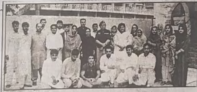
سی آر ایس ایس کے زیر اہتمام منعقدہ ورکشاپ کے اختتام پر شرکاء کا گروپ فوٹو

جلد 32 | 27 ذوالقعد 1440 ہجری بدھ 31 جولائی 2019 | شماره 07