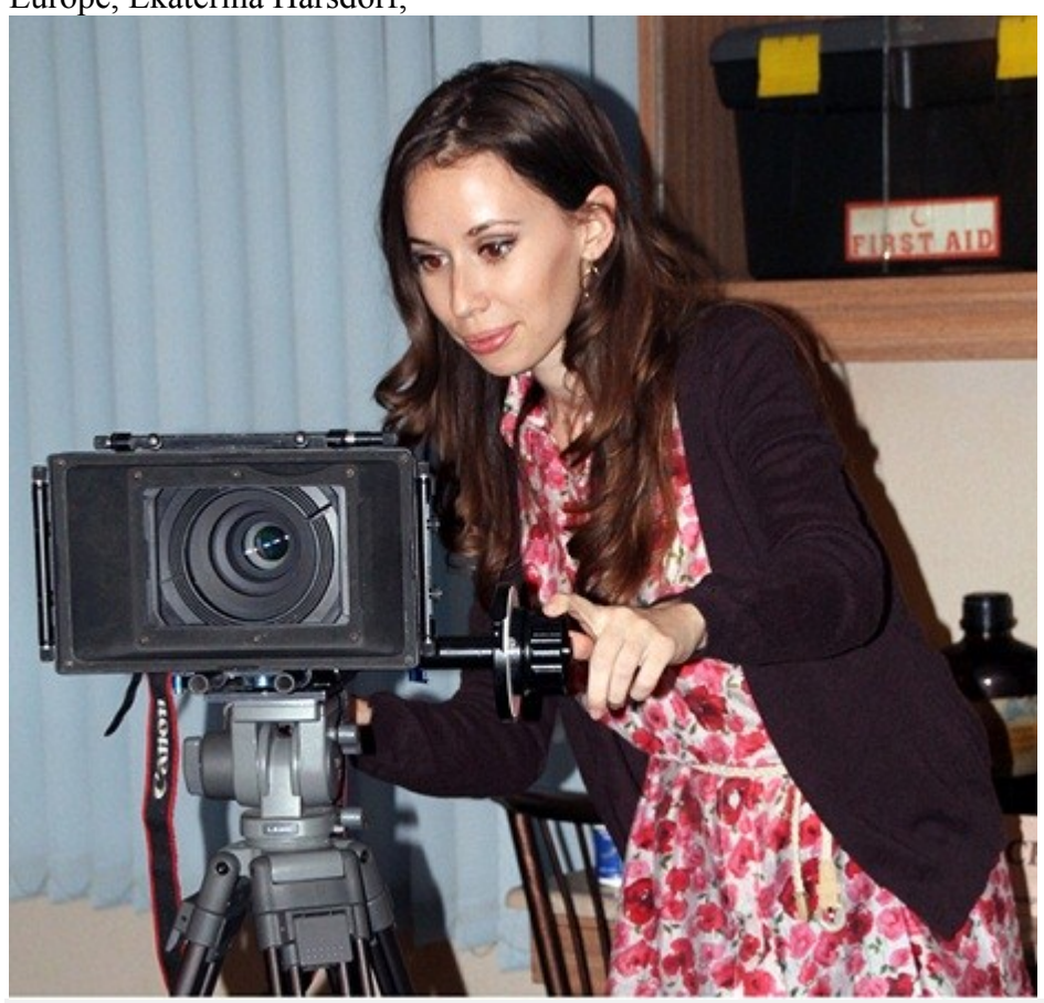
kyrgyz Journalist shoots for documentary of "Quest of Justice" in Lahore

who endows her time and work free of charge. The documentary is a brainchild of respectable Secretary Prosecution Punjab, Nadeem Irshad Kaiani who spearheads many reforms like computerization, case management, data collection and evaluation, increased and systemized