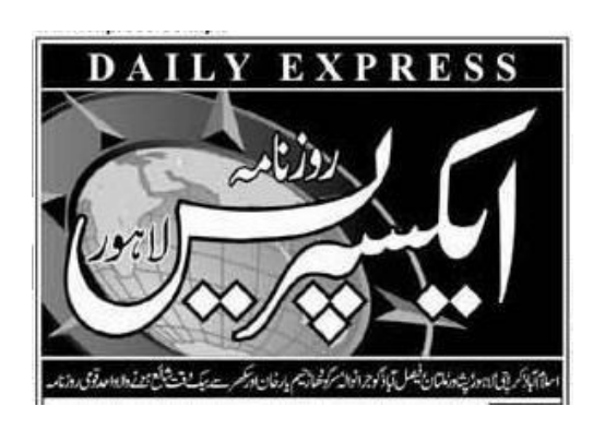
March 19, 2014