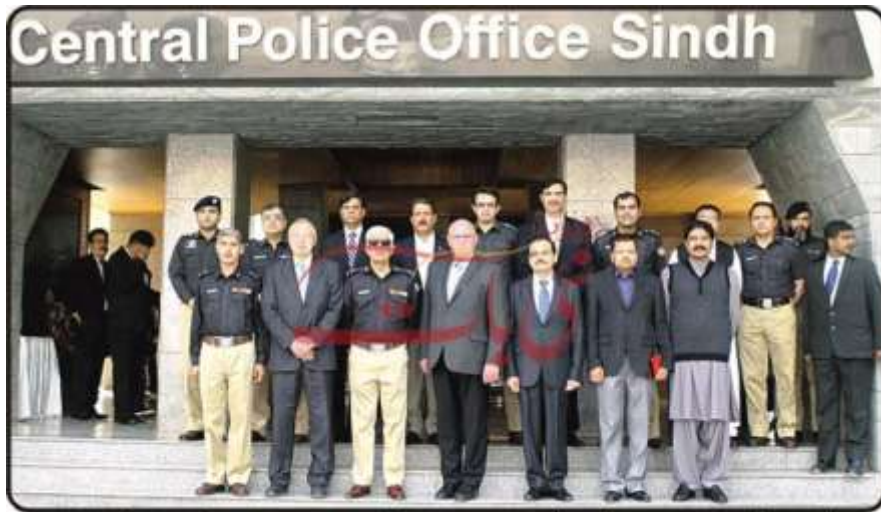
پولیس ہیڈ آفس میں جرمنی کے ڈپٹی کنسل جرنل جنس جارجن پاکنے کا آئی جی سندھ شاہد ندیم بلوچ و دیگر کے ہمراہ گروپ فوٹو