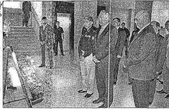
جرمن فیڈرل جرنل اور دیگر نمائندے پولیس میں دھماکے کے شہداء کی یادگار پر پھول چڑھا رہے ہیں