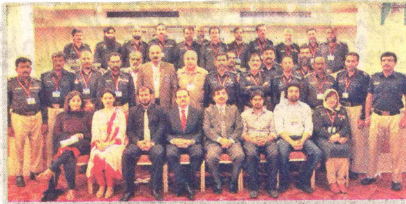
فرسٹ ریسپونڈر کورس کے اختتام پر شرکا کا سابق آئی جی صلاح الدین بابر کے ہمراہ گروپ

جلد 2 | کراچی، لاہور اور اسلام آباد سے یک وقت اشاعت | بدھ 8 مہادی الثانی 1435ھ 19 اپریل 2014ء | باقاعدہ تصدیق شدہ