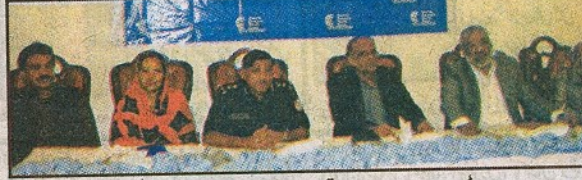
حیدرآباد: مقامی ہوٹل میں منعقدہ سیمینار کے موقع پر ڈی آئی جی شہداء اللہ عباسی و دیگر آئی جی پر پیشہ ہیں۔

حیدرآباد (بھارت پورٹ) ڈی آئی جی حیدرآباد ریجنل اللہ عباسی نے کہا ہے کہ پاکستان ایک ایسی منڈی بن ہے جہاں ہر چیز قابل فروخت اور بکاؤ بن چکا ہے، بد عنوان عناصر ایمانداری کی بات کرتے ہیں چور اور جرائم پیشہ پولیس کا نفوس کرتے ہیں جس میں کہا جاتا ہے کہ باقی صفحہ 5 بقیہ نمبر 12